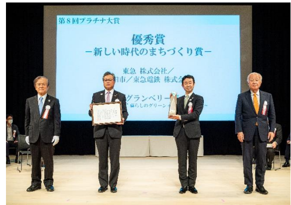
▲プラチナ大賞 授賞式の様子

「南町田グランベリーパーク」は、田園都市線「南町田グランベリーパーク駅」（2019年10月1日に「南町田駅」から改称）南側に広がる鶴間公園と、2017年2月に閉館したグランベリーモール跡地を中心とする約22haのエリアを指し、官民が連携し、都市基盤・商業施設・都市公園・駅などを一体的に再整備・再構築し、自然と賑わいが融合したパークライフを満喫できる「新しい暮らしの拠点」を創り出していくまちづくりプロジェクトが進行しています。