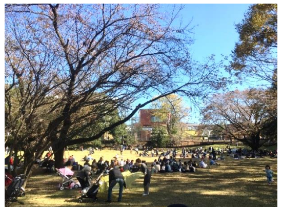
◀ (左)まちをめぐる歩行者ネットワークと14の広場