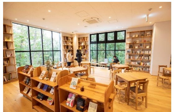
▲ 伐採材からつくった什器を配置したまちライブラリー

プロジェクトに伴って伐採など整備の手を加えることになった公園の木々に対する地域の方々の思いを新しいまちにつなげていくために、本プロジェクトでは、都市の中の緑のあり方や、その活用の方法を市民とともに学び、苗木採りや植樹、伐採材の製材などを体験するプログラムを4年にわたり実施しました。その集大成となる取組として、パークライフ・サイト内「まちライブラリー」に、公園などの伐採材から作製した本棚、椅子・テーブルなどの什器を設置し、公園の緑を眼前にした、木の香りに包まれた豊かな空間が生まれ、多くの市民に親しまれています。