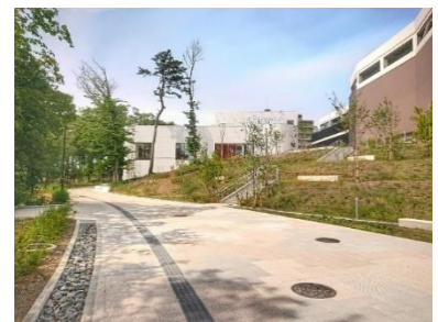
▲パークライフ・サイト内歩行者空間