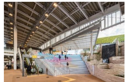
▲まちと一体感のある鉄道駅舎

まちの玄関口となる駅舎は、駅南北の往来を可能とする自由通路の架設やホームドアの設置などによる安全性の向上に加え、ホームからまちへと繋がる大階段や植栽、滝の演出などにより、駅に降り立った瞬間からまちの高揚感を感じられる設えとしました。