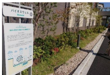
▲雨のみち: バイオスウェル

調整池や雨水貯留槽などの従来型の雨水流出抑制策に加え、自然環境が有する機能を活用するグリーンインフラを採用。敷地周辺を囲むように石を敷き詰めた隙間の多い溝状の「雨のみち: バイオスウェル」と、くぼ地状の植栽帯である「雨のにな: レインガーデン」をランドスケープのデザインへ取り込みました。