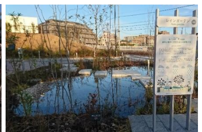
▲雨のにな: レインガーデン