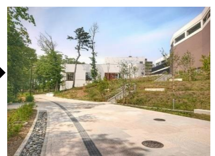
▲パークライフ・サイト内歩行者空間