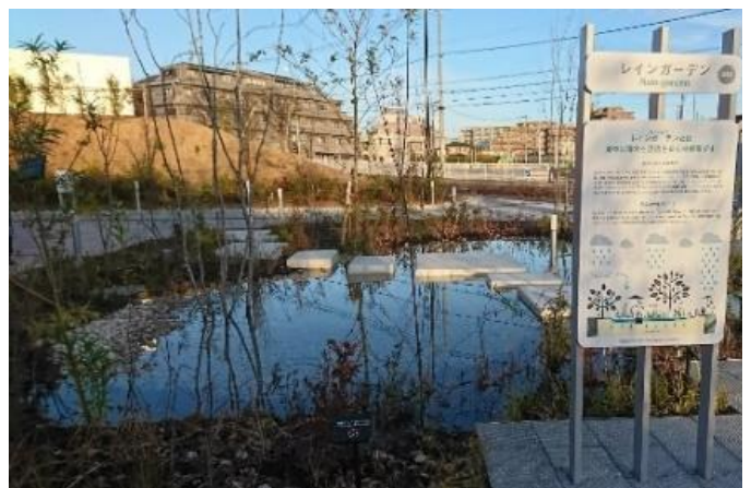
▲雨のにわ:レインガーデン