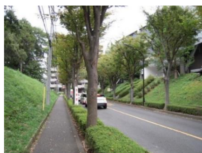
▲南1604号線※2018年6月に廃止