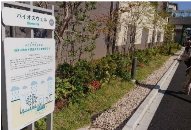
▲雨のみち:バイオスウェル

調整池や雨水貯留槽などの従来型の雨水流出抑制策に加え、自然環境が有する機能を活用するグリーンインフラを採用。敷地周辺を囲むように石を敷き詰めた隙間の多い溝状の「雨のみち:バイオスウェル」と、くぼ地状の植栽帯である「雨のにわ:レインガーデン」をランドスケープのデザインへ取り込みました。