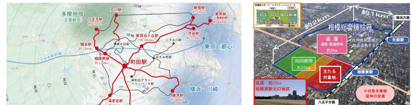
【出典】相模原駅北口地区土地利用方針