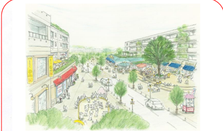
②東北ゾーンと東南ゾーンの間のイメージ(案)