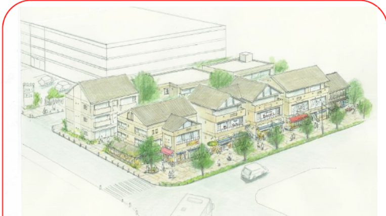
①相原駅からみた東北ゾーンのイメージ(案)