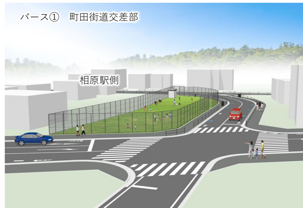
パース① 町田街道交差点部