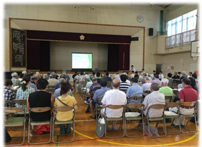
写真一 説明会当日の風景