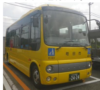
写真 一運行する 小型バス