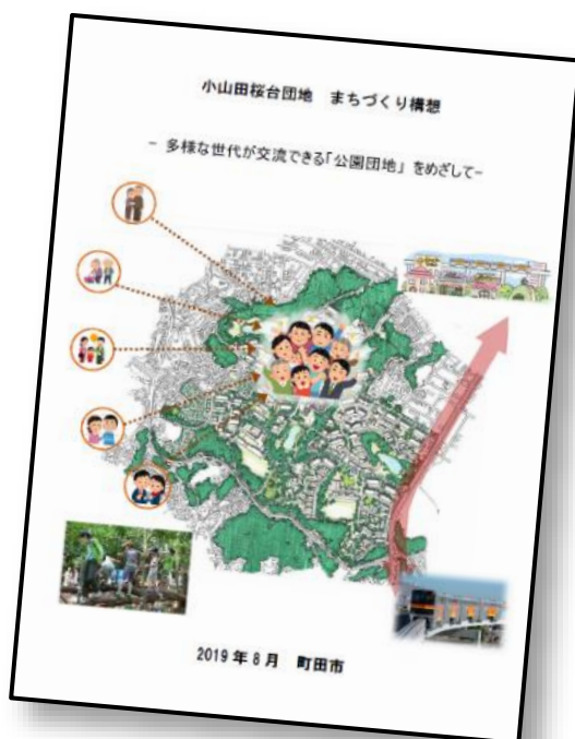
図一 小山田桜台団地まちづくり構想

( https://www.city.machida.tokyo.jp/kurashi/sumai/house/danchisaisei/oyamadasakuradaidanchi.html )