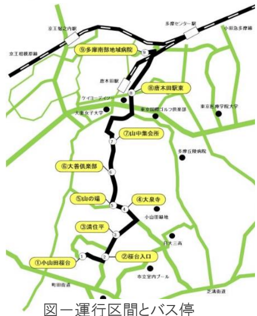
図一 運行区間とバス停

( https://www.city.machida.tokyo.jp/smph/kurashi/sumai/kotsu/rosen/karakidakensyounko.html )