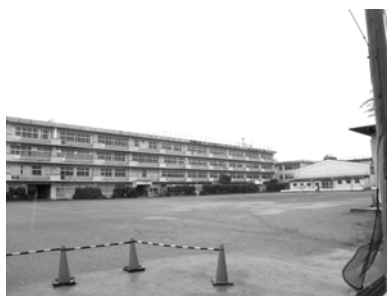
③ 本町田中学校 敷地面積：15,592 m 2 (※2011年3月に閉校予定)