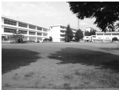
① 旧忠生第6小学校用地 敷地面積：17,354 m 2