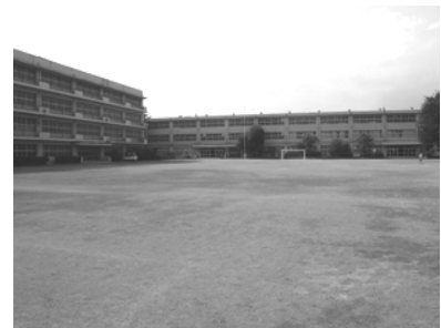
⑤ 旧緑ヶ丘小学校用地 敷地面積：14,701 m 2