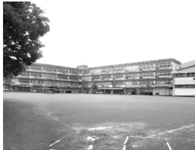
④ 旧本町田西小学校用地 敷地面積：17,617 m 2