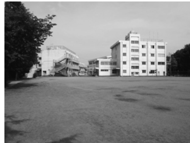
② 旧忠生第5小学校用地 敷地面積：14,342 m 2