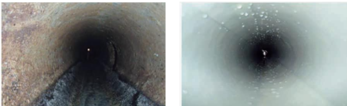
図6-7 更生工事前のコンクリートが劣化した下水道管（左）、更生工事後の下水道管（右）

「町田市ストックマネジメント計画」に基づき、点検・調査の結果をもとに改築計画を策定し、污水管・雨水管及び成瀬クリーンセンター・鶴見川クリーンセンター・鶴川ポンプ場、それぞれの劣化状況を踏まえた改築更新を実施します。