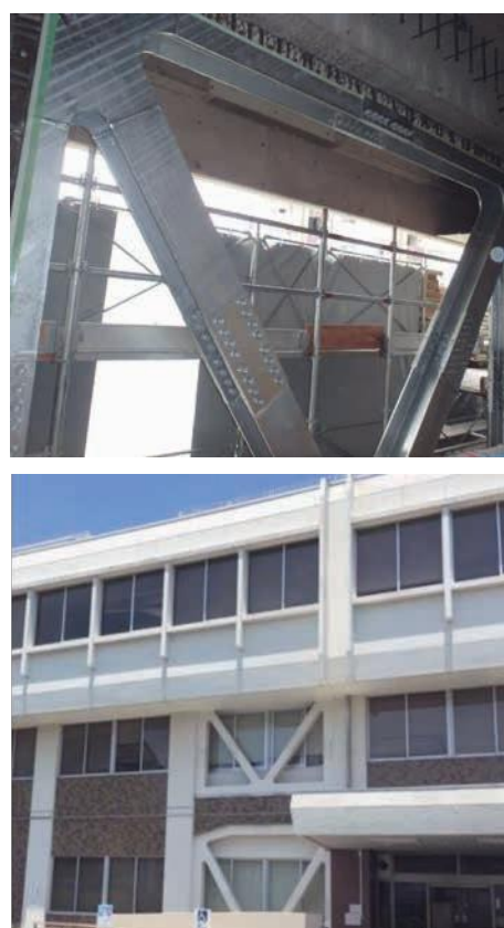
図6-5 耐震補強工事中の建物（上） 耐震化工事完了後の建物（下）