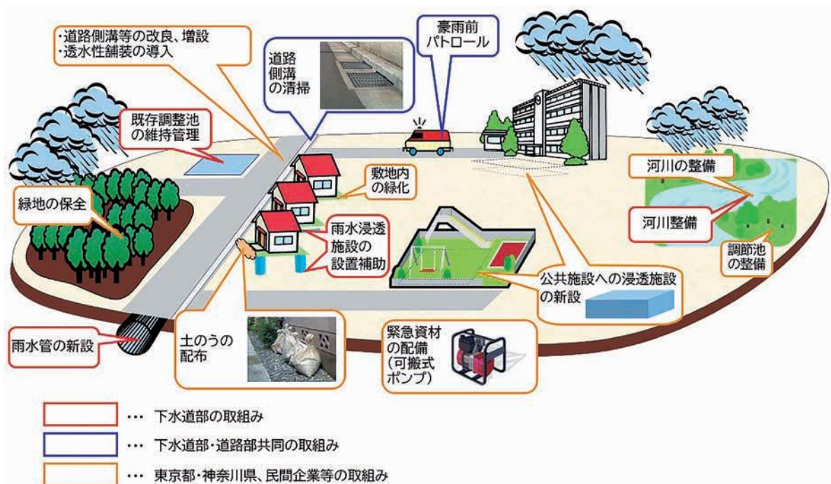
図6-3 浸水対策の概要（イメージ）

また、個人住宅への雨水浸透設備の設置補助、市内の水路や雨水調整池の計画的な維持管理、河川管理者や流域自治体と連携した流域治水も推進します。市民への浸水対策情報の発信や災害時の機能維持を目的とした「下水道事業継続計画（水害編）」の運用・訓練にも引き続き取り組みます。