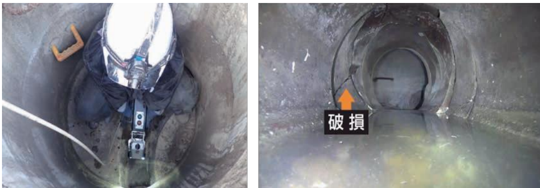
図6-6 スクリーニング調査の状況（左）、破損状況のイメージ（右）

さらに、国の「PPP/PFI推進アクションプラン」を踏まえ、維持管理と更新を一体的に委ねるなど、より高度な官民連携手法の導入を検討します。先進自治体の事例を参考に、サービスの質を維持・向上させつつ、災害時の対応体制も確保できる形で段階的に導入を進める方針です。