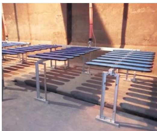
図6-1 成瀬クリーンセンターの高効率散気装置

成瀬クリーンセンターと鶴見川クリーンセンターから放流される処理水が流れ込む東京湾では、富栄養化による赤潮が問題となっています。この原因となる窒素やりんを効果的に除去するため、高度処理施設の導入を進めています。既存施設の改築に合わせて順次導入する長期計画に加え、当面の対策として、既存施設に高効率散気装置を導入し、水質向上を図ります。