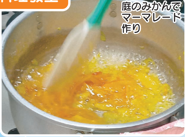
庭のみかんで マーメイド作り