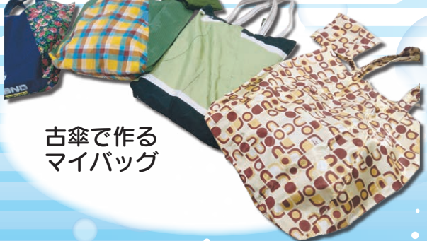
古傘で作る マイバッグ