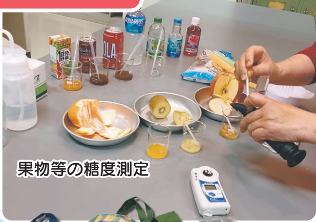
果物等の糖度測定