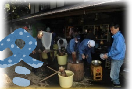
餅つき 落ち葉掃き