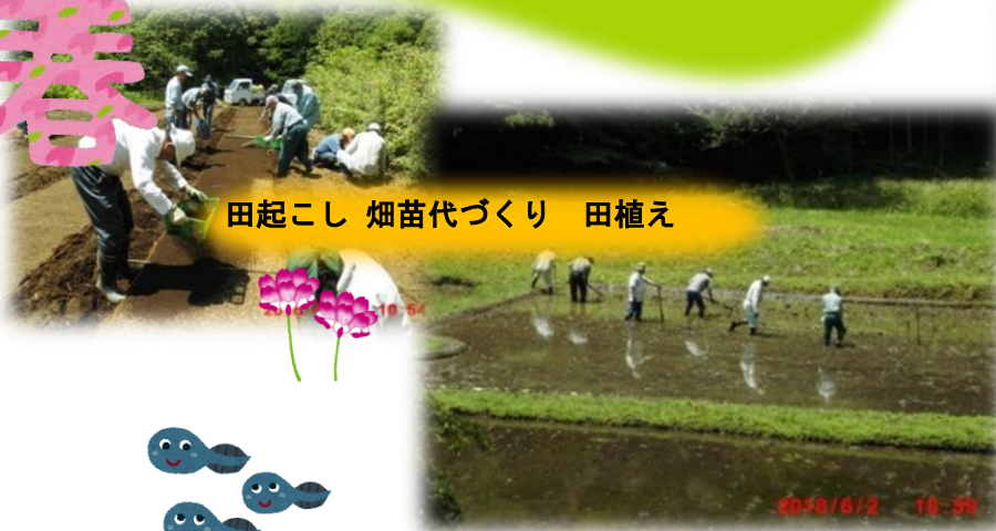
田起こし 畑苗代づくり 田植え