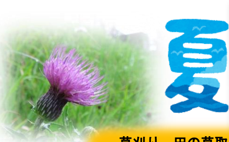
草刈り 田の草取り