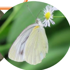
スジグロシロチョウ