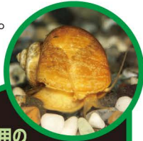
かんしょう用の ゴールデンアップルスネール

つかまえても、他の場所に持って行かないでね。飼っている貝は、池や川に放さないでね。