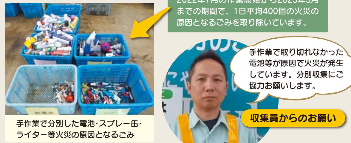
手作業で取り切れなかった電池等が原因で火災が発生しています。分別収集にご協力をお願いします。