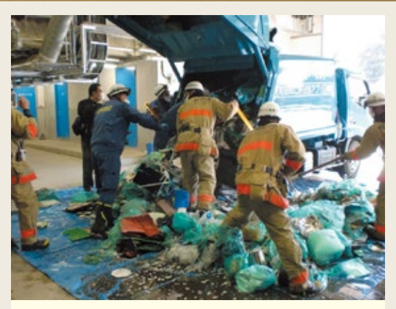
2023年2月21日に発生した火災の様子