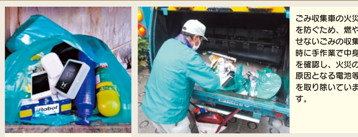
2022年7月の作業開始から2023年3月までの期間で、1日平均400個の火災の原因となるごみを取り除いています。