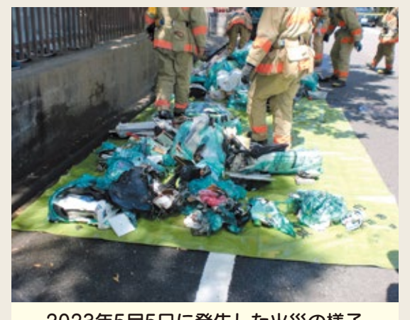
2023年5月5日に発生した火災の様子