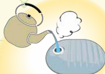
電源不要で持ち運びできる湯たんぽを上手に使う