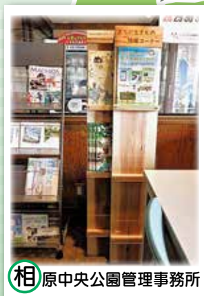
相原中央公園管理事務所