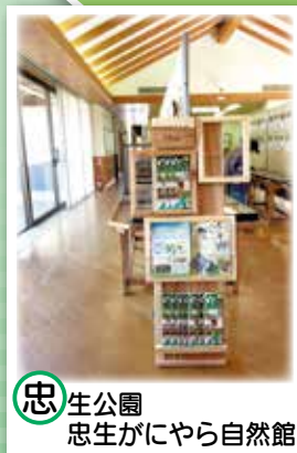
忠生公園 忠生がにやら自然館