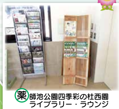
薬師池公園四季彩の杜西園ライブラリー・ラウンジ

多くの方に町田の生きものや環境の魅力を知っていただくため、市内5カ所の公園に「まちだ生きもの情報コーナー」(パンフレットラック)を設置しています。「まちだ生きもの探しマップ」、「生きもの発見レポート」、「まちだのいきものクイズ」など市のパンフレットのほか、生物多様性の保全等に取り組む市内活動団体のパンフレットをご用意しています。公園にお出かけの際には、生きもの情報コーナーをぜひご利用ください。