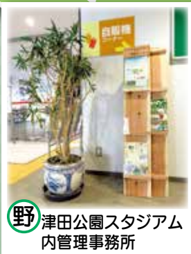
野津田公園スタジアム内管理事務所