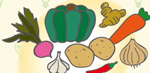
根菜類、特にしょうがなど、体をあたためる食材をとろう