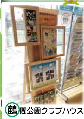
鶴間公園クラブハウス

まちだ生きもの情報コーナーは、相原の里山の間伐材を活用しています。これは、相原中央公園をフィールドとして、剪定した小枝や間伐材を使ったワークショップ活動や、樹木調査をしているkoeda plus projectに作製していただきました。