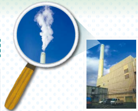
↑冬の煙突の様子 煙突の少し上で白煙になっています

A: 焼却炉から発生したガスは、中に含まれる「灰やダイオキシン」等の有害物質を基準以下まで取り除いた後に、煙突から排出されます。排出ガスの状態を24時間測定し安全であることを確認するとともに、カメラで常時監視しています。