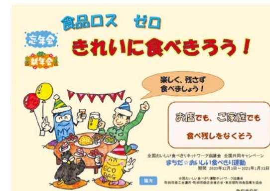
神奈川中央交通バス車内掲示ポスター