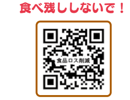
町田市役所食品ロス削減ホームページ