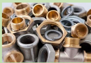
使う材料のイメージ写真