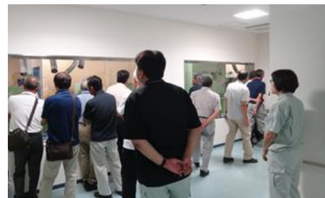
上山田資源ごみ処理施設建設地周辺の皆さんと、昭島市環境コミュニケーションセンターを見学しました。(7月25日)