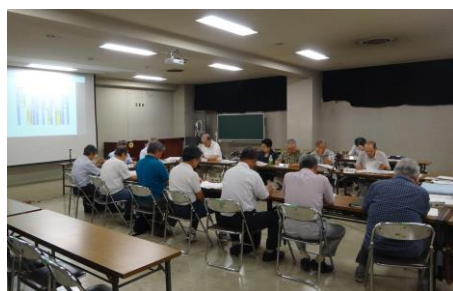
第11回町田リサイクル文化センター周辺地区連絡会を開催しました。(8月5日)

「地区連絡会」では、町田市の資源循環型施設の整備にあたり、安心かつ安全な施設を整備するため、市民の皆さんと協働して、施設の整備や運営管理に関すること等を地域のまちづくりに配慮しながら、協議を進めています。