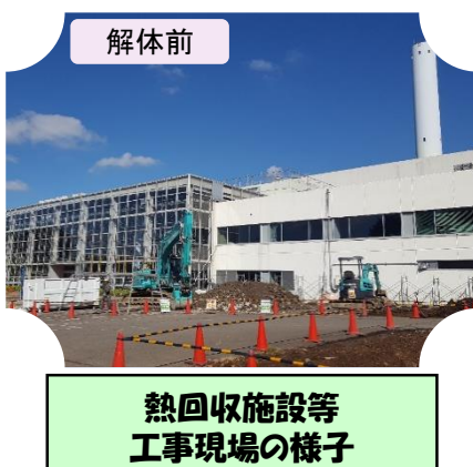
熱回収施設等 工事現場の様子