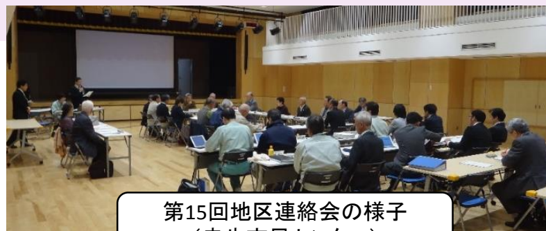
第15回地区連絡会の様子 (忠生市民センター)

第16回町田リサイクル文化センター周辺地区連絡会 開催日時: 2018年1月31日(水) 午後6時30分から 会場: 忠生市民センター 2階 ホール 定員: 10人程度(申込不要、先着順、傍聴のみ可能)