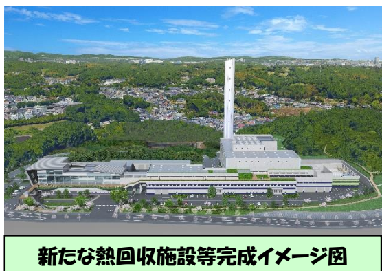
新たな熱回収施設等完成イメージ図