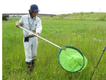
昆虫・クモ類調査