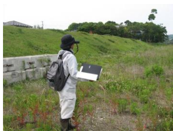
哺乳類、鳥類、植物調査