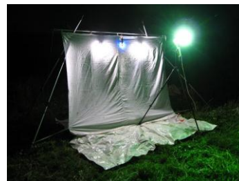
昆虫類ライトトラップ調査