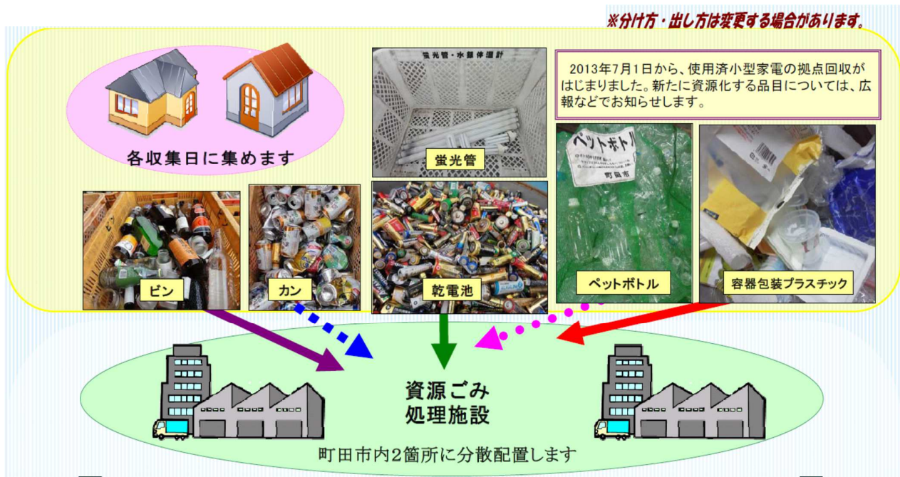
図：ごみ資源化施設建設NEWS vol.7 2013年7月15日 町田市環境資源部刊 より抜粋