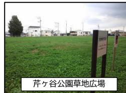
芹ヶ谷公園草地広場