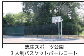
忠生スポーツ公園 3人制バスケットボールコート