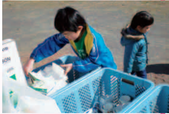
子どもたちも積極的に分別しています

真光寺3丁目町内会では、「地域の活性化」のために、住民自ら「リサイクル広場・真光寺」を運営しています。