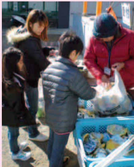
子どもたちは家でも分別名人