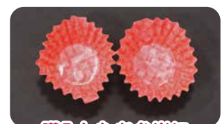
購入したお弁当に 入っていたおかずトレイ