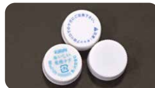
ペットボトルのキャップ