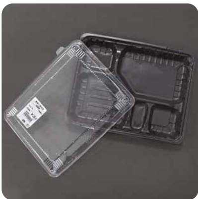
物が入っていた容器類