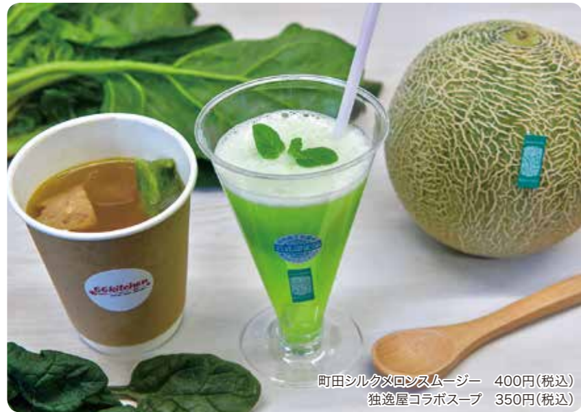
町田シルクメロンスムージー 400円(税込) 独逸屋コラボスープ 350円(税込)