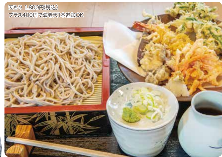
天もり 1,800円(税込) プラス400円で海老天1本追加OK