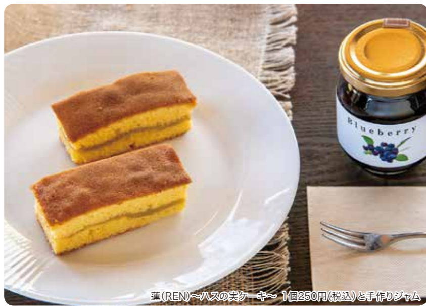
蓮(REN)~ハスの実ケーキ~ 1個250円(税込)と手作りジャム