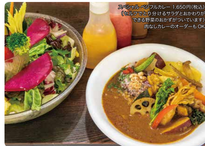
スペシャルベジフルカレー 1,650円(税込) (セルフでとり分けるサラダとおかわりが できる野菜のおかずがついています) 肉なしカレーのオーダーもOK