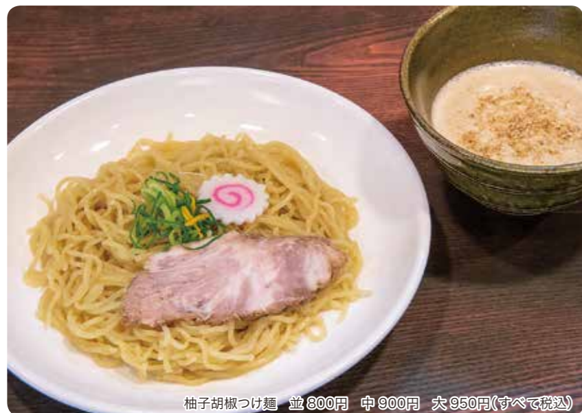
柚子胡椒つけ麺 並800円 中900円 大950円(すべて税込)