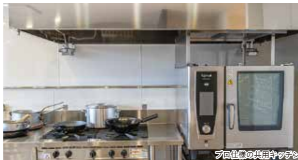
プロ仕様の共用キッチン