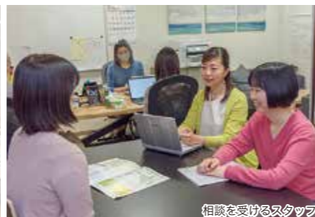
相談を受けるスタッフ