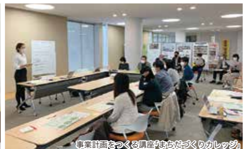
事業計画をつくる講座「まちづくりカレッジ」