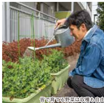
皆で育てる野菜は収穫も自由