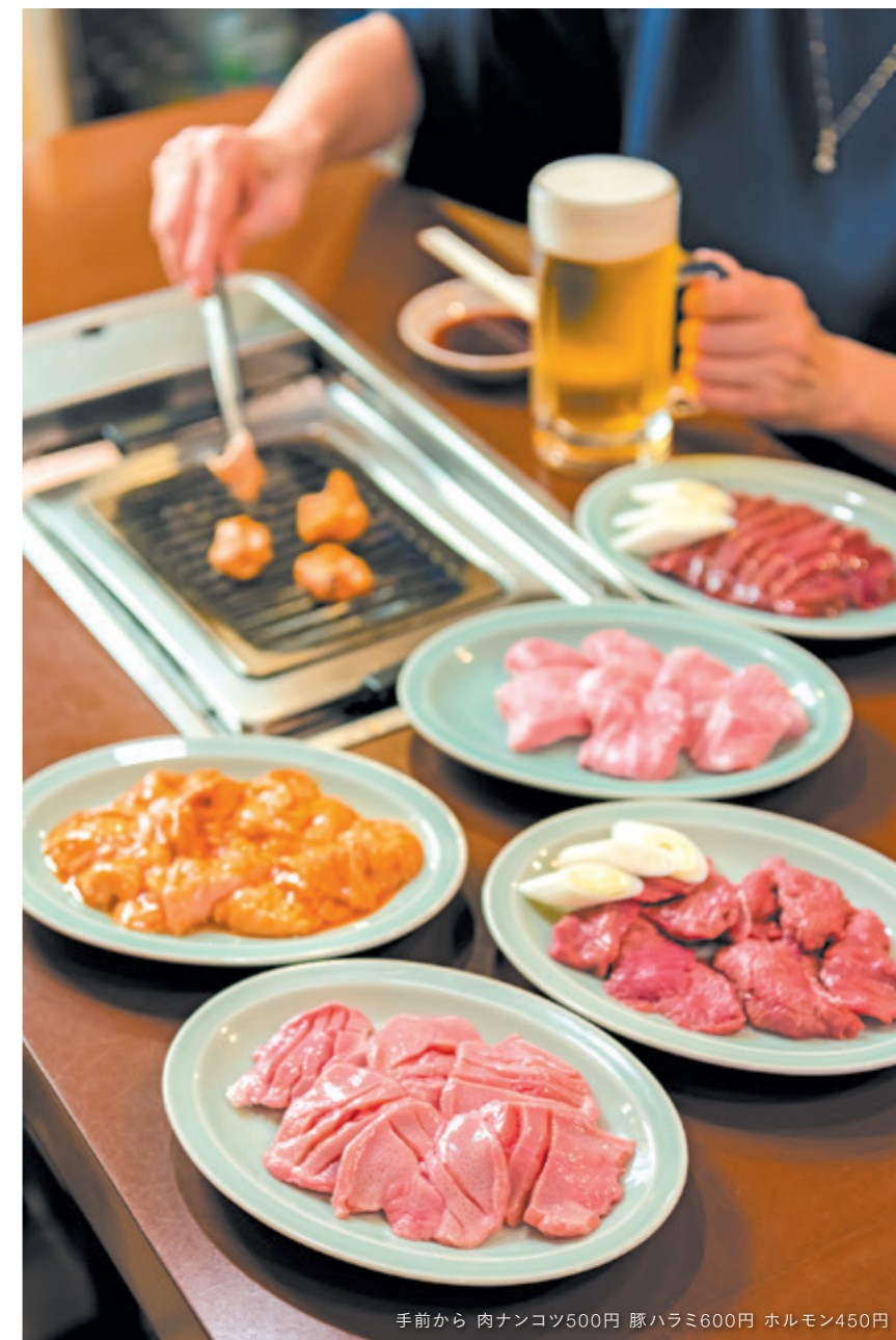
手前から 肉ナンコツ500円 豚ハラミ600円 ホルモン450円