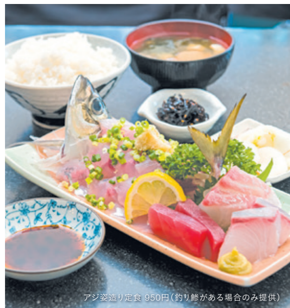
アジ姿造り定食 950円(釣り鰯がある場合のみ提供)