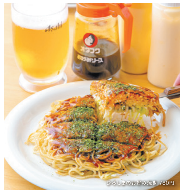
ひろしまのお好み焼き 780円