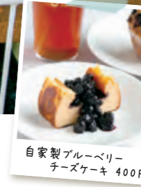
自家製ブルーベリーチーズケーキ 400円

町田市山崎町1877-1 042-851-9213 水・土のみ営業 11:00~17:00 P7台 ブルーベリー収穫は7月初旬~8月中旬 体験は要予約 期間中は水休 詳しくはHPを http://bbfactory.com/