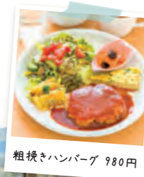
粗挽きハンバーグ 980円