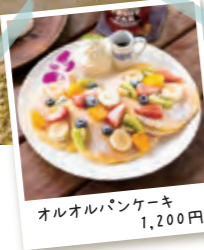
オルオルパンケーキ 1,200円

町田市大蔵町2790-1 042-708-9255 月水木9:00~17:00(平日夜は予約のみ) 金土日祝9:00~21:00 火休 P有り http://oluolu-aina.com/