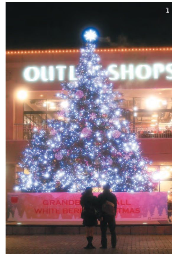
1.2.3. モール内もツリーも幻想的で美しいグランベリーモール。ショップではクリスマスセールも。※写真は2014年 4. ターミナルプラザ前、高さ20mのツリー