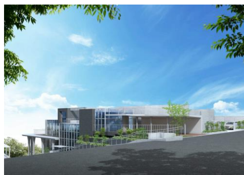
（市道町田 219 号線より）

今後も、コミュニティセンターの建て替えに関する進捗や情報をこの「建て替えだより」やホームページ等でお知らせしてまいりますのでよろしくお願いいたします。