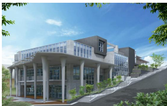
（市道町田 408 号線より）