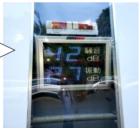
④騒音振動計の設置 騒音振動計を設置し、騒音振動レベルを確認しながら作業を行っています。