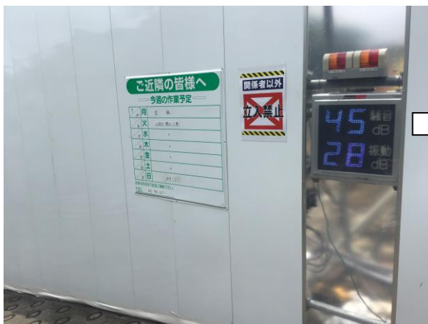
③お知らせ看板の設置 お知らせ看板を設置し、週ごとの作業予定をお知らせしています。