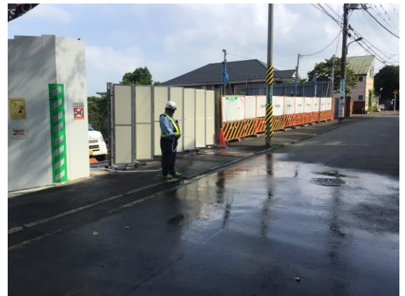
②工事ゲート前 交通誘導員を配置して安全管理を行っています。