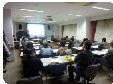
自然災害時の活用法を学んだ