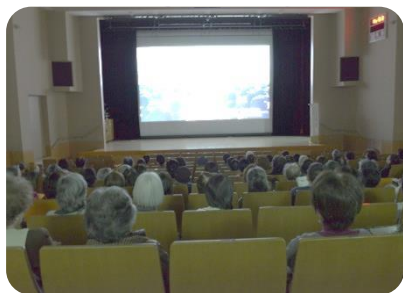
ドキュメンタリー映画上映会