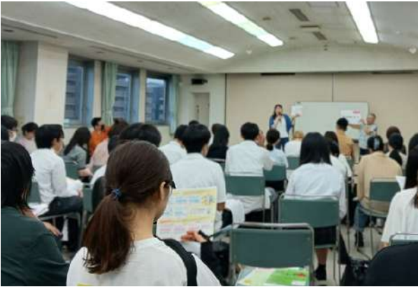
まちだ地域まるごとキャンパスのプログラム説明会の様子