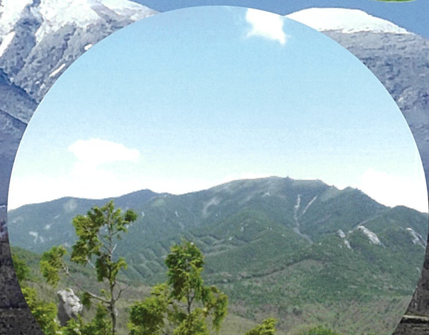
日本百名山 甲武信岳・金峰山 ユネスコエコパーク