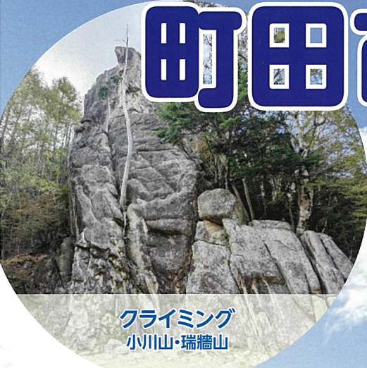
クライミング 小川山・瑞牆山