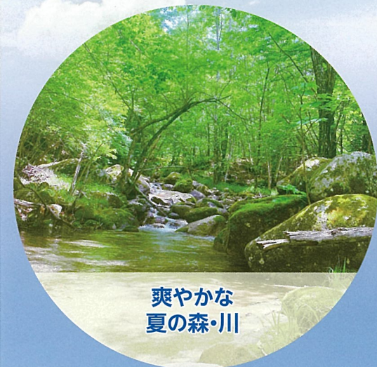
爽やかな 夏の森・川

秩父多摩甲斐国立公園内にあります「星のふるさと」町田市自然休暇村は、標高1,500mで暑さ知らず。周囲は、から松・白樺などの木々に囲まれ、村内には千曲川の支流梓川も流れています。つつじ・しゃくなげなどの咲く春、琥珀色の空の夏、紅葉と静かな星空の秋、雪や霧氷と晴天の多い冬、四季折々の表情で迎えてくれます。