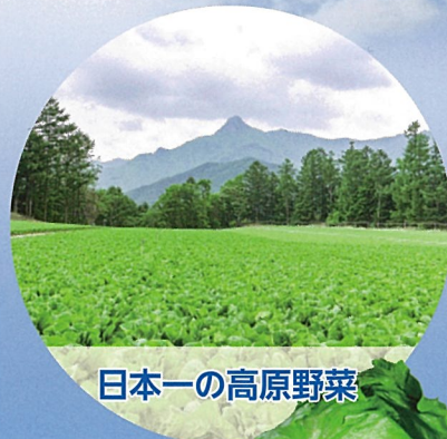
日本一の高原野菜

3～10月／溪流釣り(イワナ、ヤマメ) 5月／川上村山菜まつり 6～11月／登山、ハイキング 7～8月／避暑、川遊び 9～11月／紅葉、きのこ狩り 12～3月／スキー＆スノーボード