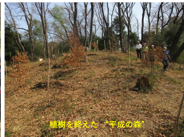
植樹を終えた“平成の森”