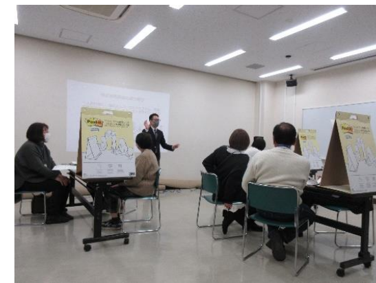
町田市地域ホットプラン