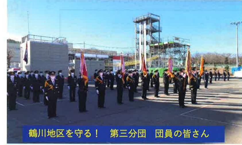
鶴川地区を守る！ 第三分団 団員の皆さん