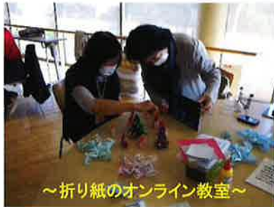
～折り紙のオンライン教室～