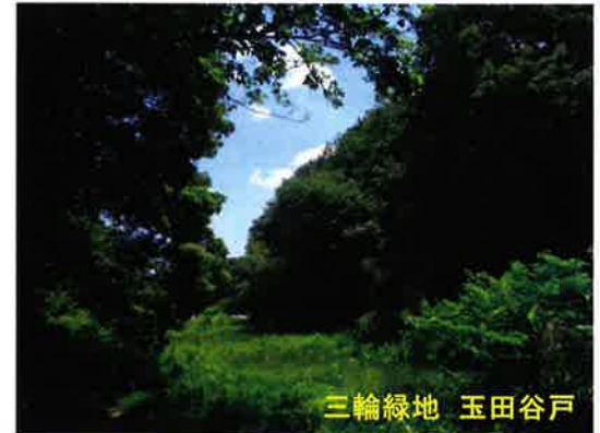
三輪緑地 玉田谷戸