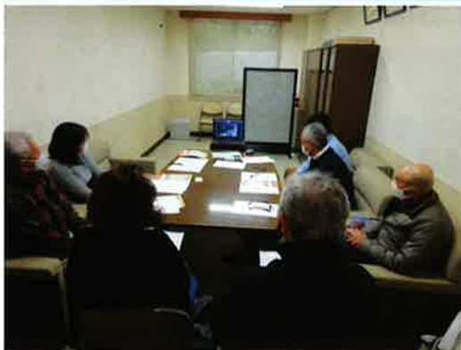
食品提供者 及び提供先 など地域活 動グループ を交えた鶴 川フードバ ンク事業運 営調整ミー ティングの 様子 (Zoom 参加含む)