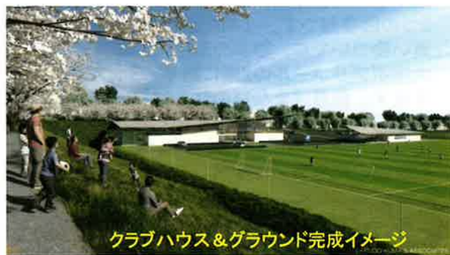
クラブハウス&グラウンド完成イメージ 工事期間：開始2020年6月25日～終了予定2021年7月

緑豊かな三輪緑山の素晴らしい景色にとけ込み、自然と調和した建物となるようデザインしていただきました。町田市の木で、ゼルビアの名前の語源となっているけやき(ゼルコヴァ)をモチーフとした大小二つの跳ね屋根で、新拠点を象徴するゲートとしての建築をつくります。建造物全体にあたたかみのある雰囲気を出し出すことで、使用する選手だけでなく、ここを訪れる皆様が落ち着ける空間となることを意識しております。周囲の桜並木など現状の景観を最大限活かし、また同時に外周路なども整備して地域に開かれた、近隣住民との共生を深く感じさせる施設を目指します。