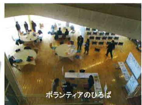
ボランティアのひろば