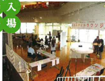
主催：鶴川地区協議会