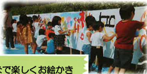
みんなで楽しくお絵かき

サレジオ工業高等専門学校・多摩美術大学の協力により、ソーラーSLの運行(154名試乗)やライブペインティング(150名参加)を実施しました。