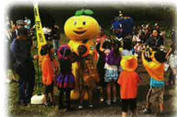
ハロウィンパレード(160名参加)にはゆず郎やペキータの姿も