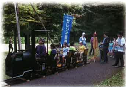
太陽の力でどの位走れるかな?

サレジオ工業高等専門学校・多摩美術大学の協力により、ソーラーSLの運行(154名試乗)やライブペインティング(150名参加)を実施しました。