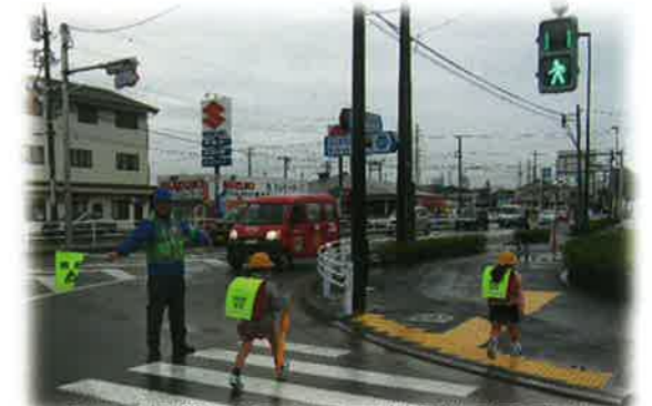
町田街道で児童の下校時に見守り

登下校時の児童の見守りや、高齢者の見守り活動を充実させるため、さまざまな支援を行っています。