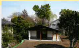
牢場遺跡の遺構覆