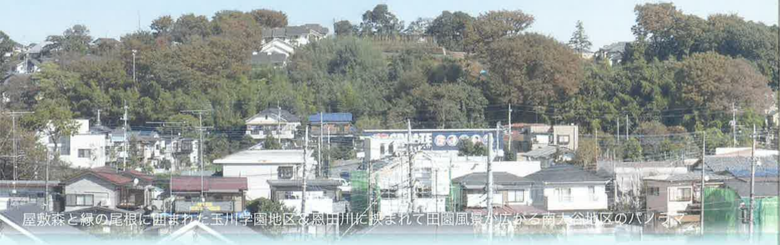
屋敷森と緑の尾根に囲まれた玉川学園地区と恩田川に挟まれて田園風景が広がる南大谷地区のパノラマ