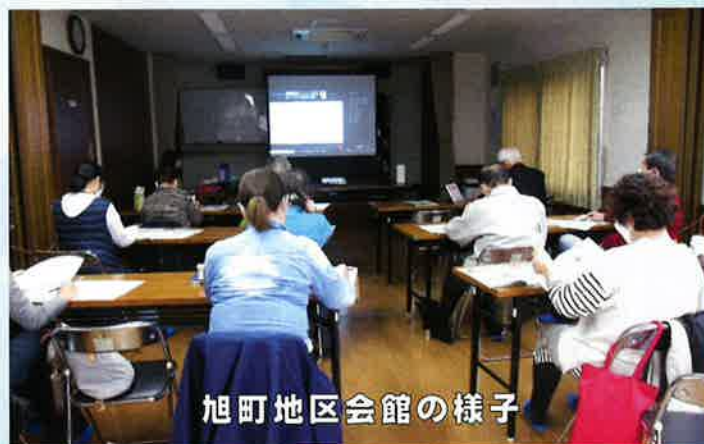
旭町地区会館の様子