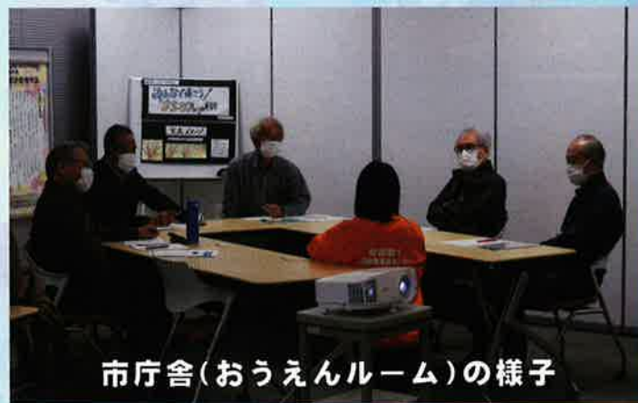
市庁舎（おうえんルーム）の様子