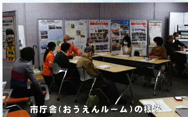
市庁舎（おうえんルーム）の様子