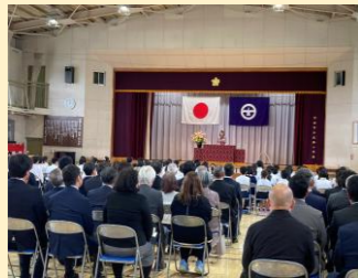
成瀬小学校開校式