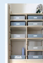
高ヶ坂ふれあいセンター

この度、地区内の町内会・自治会向けに、新しく「チラシ配布用の棚」を作成いたしました。広報誌や活動案内など、地域の諸団体の皆さまの情報発信の場としてご活用いただけます。地域を盛り上げる情報をお待ちしております。ぜひお気軽にご活用ください！