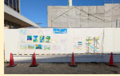
まつり期間工事中の子どもクラブに子どもたちの作品「未来の街」絵画展示