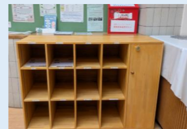
成瀬コミュニティセンター