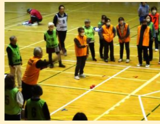
東京都市町村ポッチャ大会