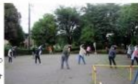
オレンジ色のぼりを立てて、体操しています