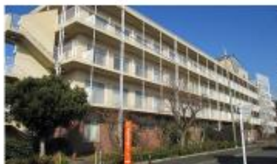
オレンジ色の看板が目印

TEL: 042-728-9215 FAX: 042-728-6578 所在地: 森野4-8-39 交通: 町田駅より山崎団地行き他バスにて9分「市民病院前」下車、徒歩5分。