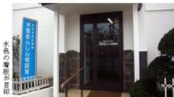
水色の看板が目印

TEL: 042-794-7901 FAX: 042-794-7902 所在地: 木曾東1-34-10 ちひろマンション101 交通: 町田駅より木曾南団地行き・小山田桜台行き・野津田車庫行き他バスにて7分「東川団地入口」下車、徒歩1分。