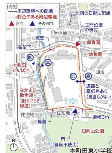
【敷地周辺イメージ】