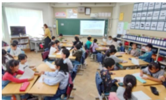
2024 年度の授業の様子