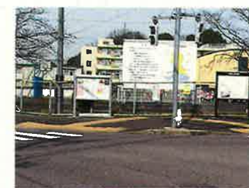
②隣道より第2グラウンドを見る