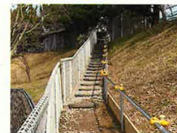
④駐車場からの動線（現学童への動線）