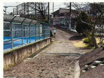
③校庭より第2グラウンドを見る